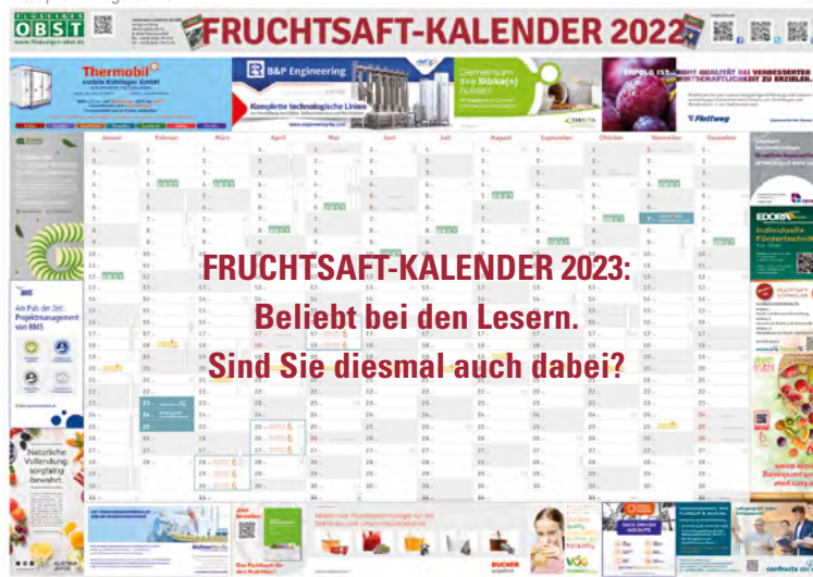
Alle Preise zzgl. MwSt.

12 Monate im Blickfeld Ihrer Kunden in der Fruchtsaft- und AfG-Industrie!